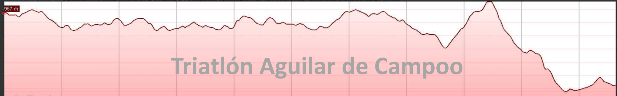
Gráfico: min., media, máx. Elevación: 898, 943, 966 m Total de intervalo: Distancia: 10,6 km | Incremento/pérdida de elevación: 135 m, -190 m | Pendiente máxima: 9,2%, -14,7% | Pendiente media: 2,6%, -3,1%

Cadete: 1 vuelta directa a Aguilar = 10km