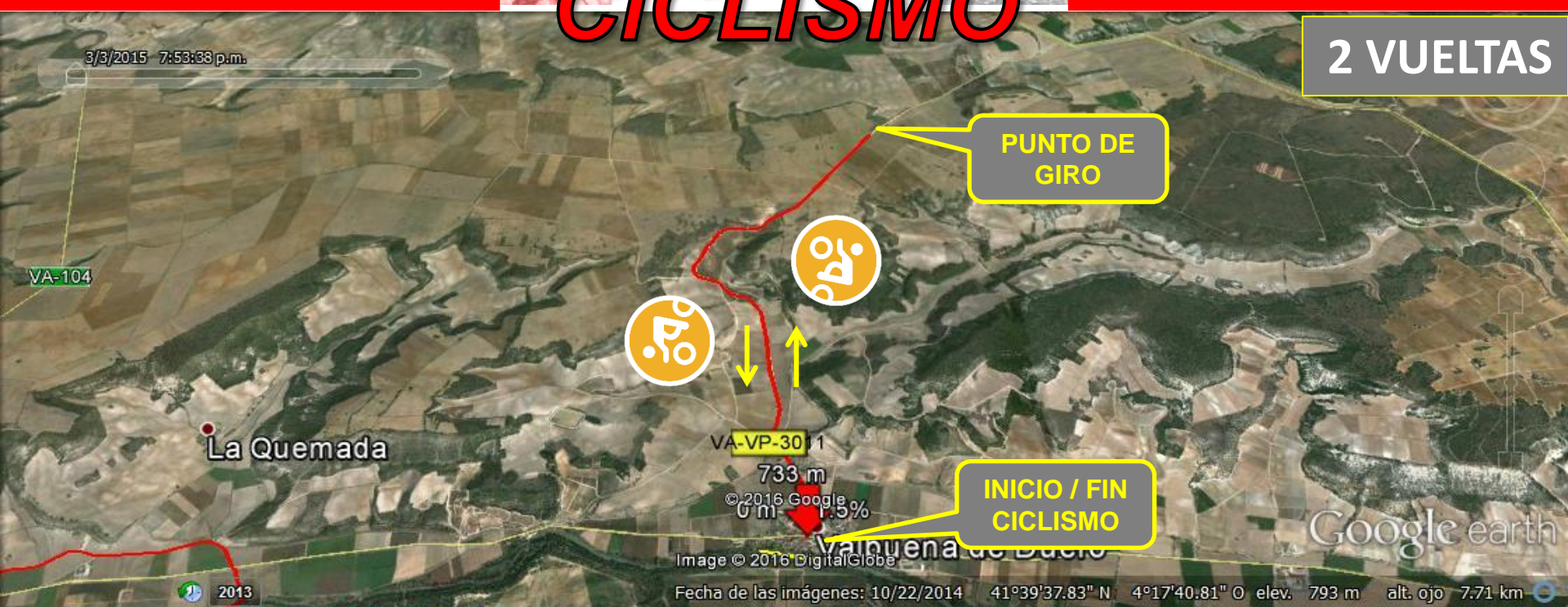
Gráfico: min., media, máx. Elevación: 733, 815, 887 m Total de intervalo: Distancia: 10 km Incremento/pérdida de elevación: 181 m, -180 m Pendiente máxima: 17.7%, -17.6% Pendiente media: 3.5%, -3.5%