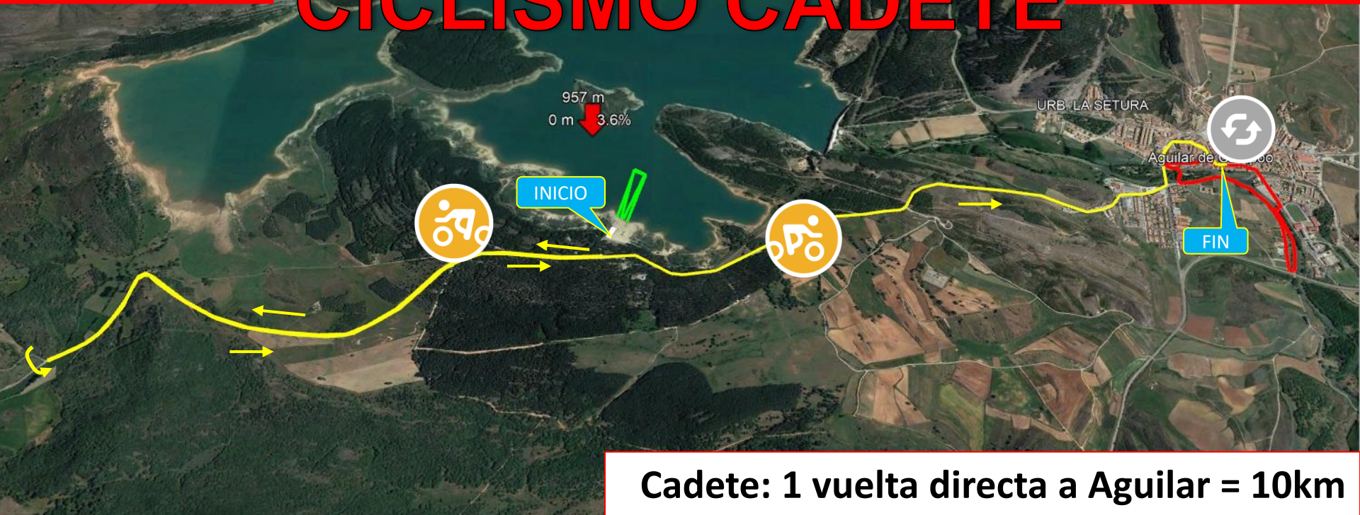
Gráfico: min.. media. máx. Elevación: 898, 943, 966 m Total de intervalo: Distancia: 10.6 km | Incremento/pérdida de elevación: 135 m, -190 m | Pendiente máxima: 9.2%, -14.7% | Pendiente media: 2.6%, -3.1%